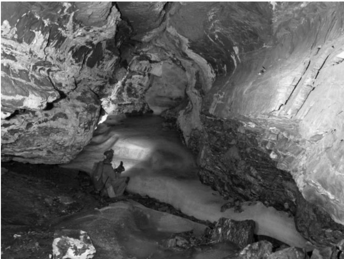
Obstanser Eishöhle (2008) (Foto: Werner Mache)